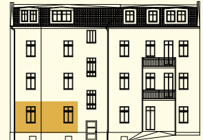
VOM INNENHOF AUS