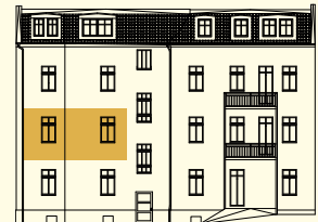
VOM INNENHOF AUS