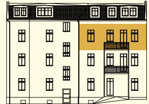
VOM INNENHOF AUS